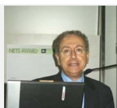
Eugenio Yunis (WTO)