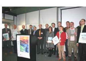
NETS AWARD Preisträger